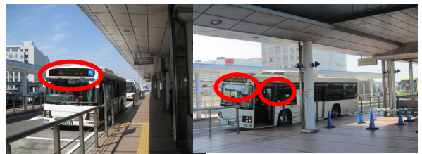
バスの行先表示をご確認下さい 複数の行き先のバスが来ます

バスのフロントガラス左上に「コスモスクエア駅～インテックス大阪」また、乗車口に「FOOD STYLE Kansai 2025」、「ラーメン産業展 in Kansai」の案内が掲示されておりますので、ご確認の上、ご乗車ください。